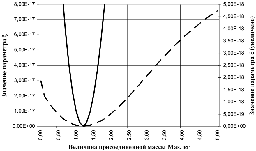
Рис. 3 – График зависимости параметра \xi_i от величины присоединенной массы M_{as} .

Для численного эксперимента были приняты такие же исходные данные, как и в предыдущем случае, за исключением информации о величине присоединенной массы. Будем предполагать, что точка приложения сосредоточенной нагрузки известна, а величина присоединенной массы не превышает 5 кг.