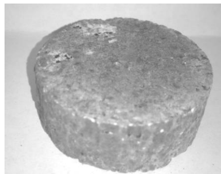
Рис. 3. Композит (титан, Al_2O_3 на рідкому склі)

Для зразків з менш жаростійкими елементами (титанова губка+базальтова смола (епоксидна смола+базальтова мука)+рідке скло+ Al_2O_3 ) характерна проблема «витягування» керамічного розчину через кипіння базальтової смоли, що викликає потребу в плавному охолодженні в діапазоні температур 1100–800 °С для рівномірного розподілу рідких компонентів по об'єму зразка (рис. 3). Перевагою таких матеріалів є формування по об'єму матеріалу порот, повністю закритих керамічною матрицею, що утворює аналог ефекту термосу, знижуючи теплопровідність матеріалу.