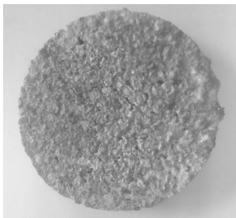
Рис. 2. Композит (титан, базальтова смола, Al_2O_3 на рідкому склі)

Для зразків з керамічною матрицею на основі жаростійких елементів (титанова губка+рідке скло+ Al_2O_3 ) характерним є утворення більш якісних зв'язків за рахунок проникнення оплавленого керамічного композиту (розчин корунду в рідкому склі) в більш дрібні пори титанової губки через наближення температури спікання у вакуумі до температури плавлення силікатної глиби 1200–1300 °С (рис. 2).