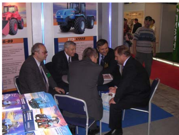
Переговори керівництва ХТЗ з керівниками фірми «Фенд»