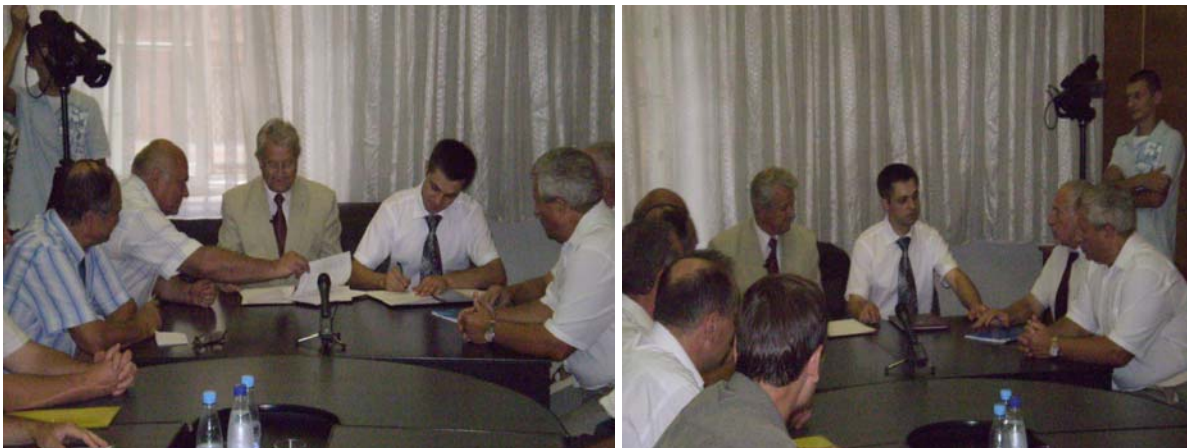
Подписание договора между НТУ «ХПИ» и ОАО «ХТЗ» о создании нового трактора с бесступенчатой трансмиссией

Цель указанного проекта - научное обоснование оптимальной схемы бесступенчатой двухпоточной гидрообъемно-механической трансмиссии для перспективного трактора ХТЗ мощностью 240 л.с., ее автоматизированное проектирование - выпуск рабочих чертежей, создание базы покупных изделий, сборка трансмиссии и ее испытание на тракторе в полевых условиях совместно со специалистами завода.