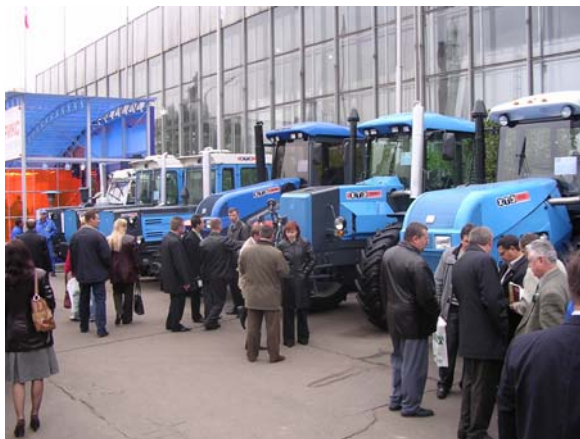
Лінійка тракторів ХТЗ на виставці ВДНХ в Москві

тракторів ХТЗ-17221, ХТЗ-17021, ХТЗ-16331 і ХТЗ-3110. Началась модернізація гідравлических і електрических систем указаних тракторів. Была существенно модернізована кабіна з точки зору ергономіки і дизайну, для чого були привлеченні найкращі дизайнерські фірми Києва і Дніпропетровська. В результаті модернізації вся лінійка нових тракторів ХТЗ получила сучасний дизайн. Уже в октябрі 2006 года они експонувались на міжнародній виставці «Золота осінь» в Москві і вызвали не лишь би якую заінтересованность.