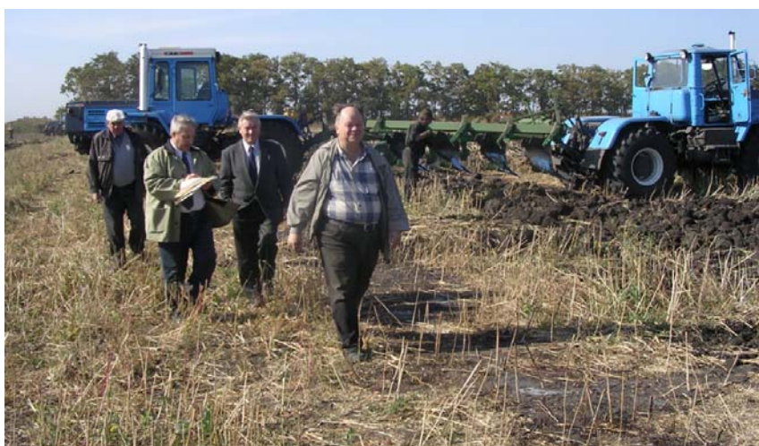
Совместные полигонные испытания ОАО «ХТЗ» и НТУ «ХПИ»