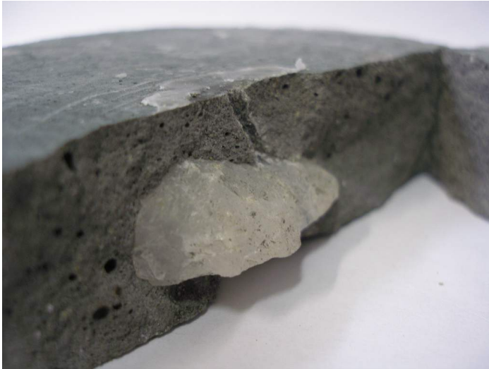
Рисунок 1 – Характер руйнування зразка з включенням кристалу (над кристалом у породи видно слід від каналу розряду)

роїмпульсній дезінтеграції порід цими установками був повним і були відсутні втрати, які притаманні механічному роздвінненню.