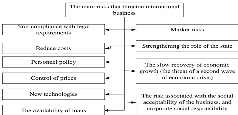
Fig. 1. The main risks that threaten the international business