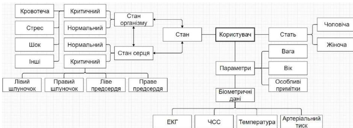
Рис. 3 – Концептуальна структура онтологічної бази знань

де C_s(c_i) – множина класів в онтології OntoMain ; c_i, c_j – класи в онтологіях OntoMain і OntoRpe , які входять в множину C онтології OntoRules ; R – відношення між класами онтології.