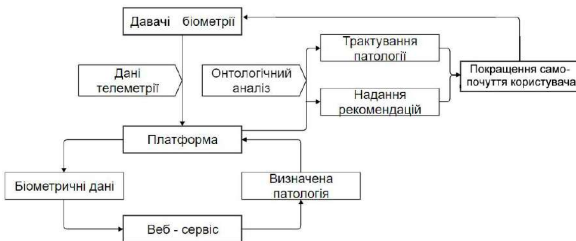
Рис. 1 – Структура роботи пропонованого підходу

Перевагою онтологій як збору знань є формальна структура, яка дозволяє спростити їх комп'ютерну обробку. У даному випадку використання онтології, дозволяє обробляти складну, різноманітну та неструктуровану інформацію, що збільшує ефективність розпізнавання семантичних