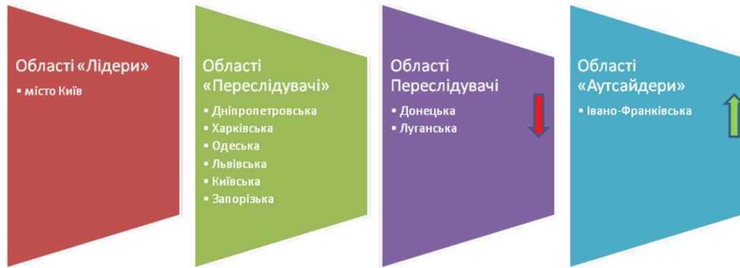
Рис. 3. Динаміка результатів кластерного аналізу

привабливості регіонів із використанням інтегрального показника, побудованого на основі комплексу факторів з урахуванням їх вагомості. Результати, отримані в процесі проведених розрахунків, у цілому співпадають із загальною статистикою по міграції в межах України.