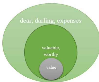
Рис. 2 ЛСП «Value»

Висновки. Наше дослідження присвячене моделюванню ЛСП «Value» в англійській мові на прикладі твору О. Генрі «The Gift of the Magi». Використання теорій лексико-семантичного поля і відповідних методик його вивчення дозволило уточнити визначення поняття «поле», виявити і описати лексичні одиниці, які слугують номінації цінності у творі, змоделювати ЛСП «Value» та виявити зв'язки його складників, поєднаних гіперо-гіпонімічними відношеннями.