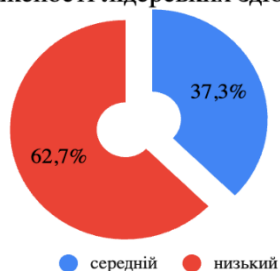
Рівні вираженості лідерських здібностей

Розвиток лідерського потенціалу майбутніх педагогів вищої школи є важливим компонентом їх фахової підготовки. Сучасні методики навчання мають бути орієнтовані на формування у студентів навичок лідерства, які зможуть впливати на якість їх професійної діяльності в майбутньому.