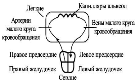
Рис. 1. Схема малого круга кровообращения

У беременной с нарушениями сердечно-сосудистой системы давление в легочных сосудах соответствует значениям: