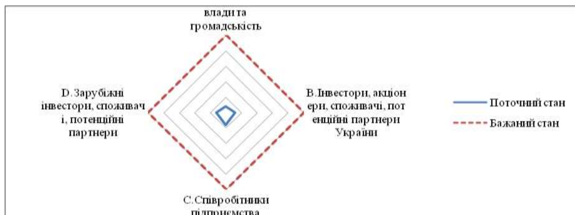
Рисунок 2 – Профіль PR- активності ПАТ «Верхньодніпровський машинобудівний завод»

PR- активності різний, але бажаного рівня немає у жодного підприємства (рис 2, 3).