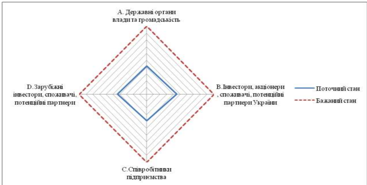
Рисунок 1 – Зіставлення профілів нинішньої та бажаної PR- активності металургійних та машинобудівних підприємств України

Аналізуючи побудовані профілі нинішньої та бажаної PR - активності, представлені на рис.1, бачимо, що металургійні та машинобудівні підприємства не приділяють достатньо уваги цієї області діяльності. Про це свідчить велика різниця між нинішнім та бажаним профілями.