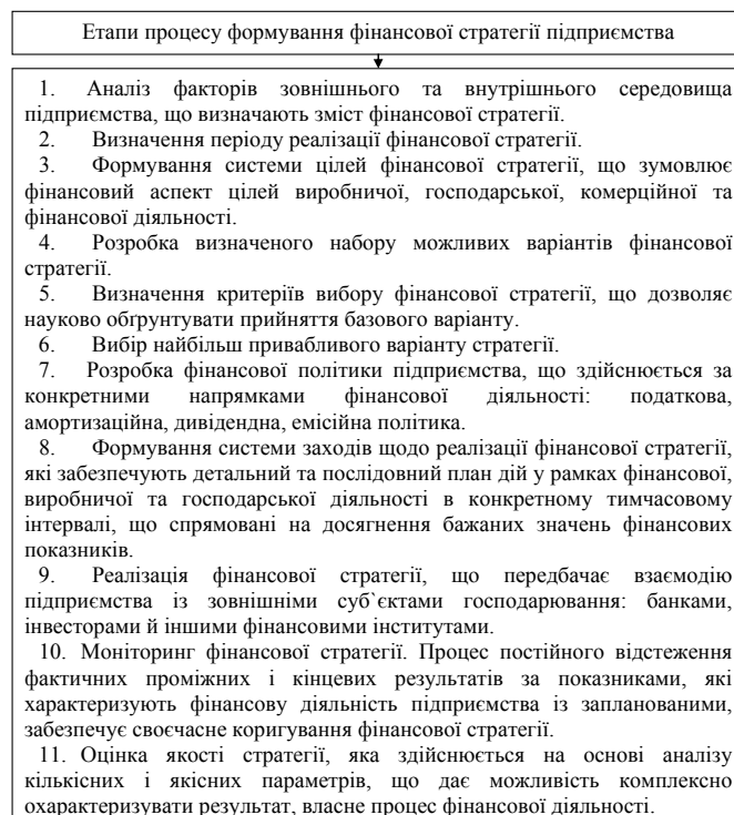
Рис. 1. Етапи процесу формування фінансової стратегії підприємства

Етапи процесу формування фінансової стратегії підприємства наведено на рис. 1. Алгоритм формування фінансової стратегії підприємства зображений на рис. 2.