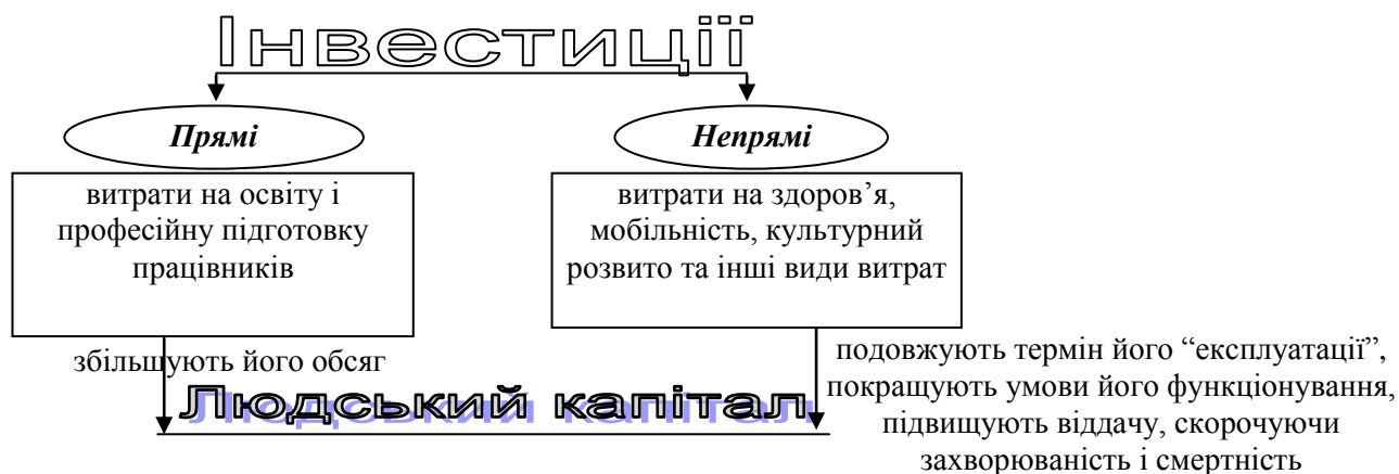
Рис. 2. Види інвестицій в людський капітал

Витрати на використання людського капіталу є прямими, всі інші – непрямими і відображаються в складі поточних витрат. Проте непрямі витрати не повинні виступати витратами поточного періоду, їх слід вважати капітальними інвестиціями, які відносяться на збільшення вартості активів.