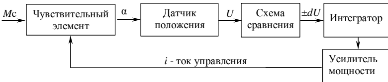
Рис. 3. Структурная схема управления положением чувствительного элемента

Основная задача, решаемая при разработке чувствительного элемента – обеспечение равенства M_b и M_c с высокой точностью. Достичь этого можно, применяя следящую систему по положению чувствительного элемента, структурная схема которой изображена на рис. 3.