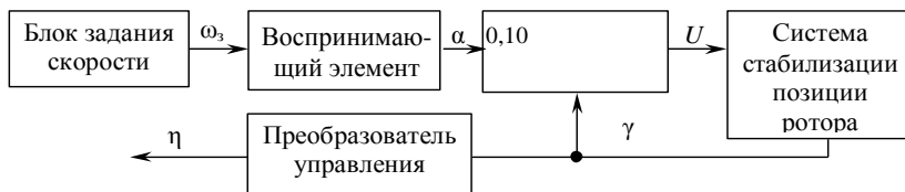
Рис. 4. Структурная схема вискозиметра

С учетом рассмотренных особенностей отдельных элементов устройств структурная схема вискозиметра имеет вид, представленный на рис. 4.