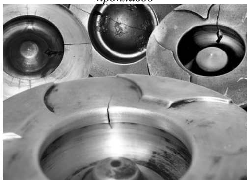
Рис 2. Примеры возникновения трещин в зоне кромок камер сгорания

В целом накопленный фактический материал позволяет осуществлять анализ причин выхода из строя поршней и на этой основе осуществлять поиск путей повышения надежности конструкций. При этом перед разработчиками стоит задача обеспечения заданного термонапряженного состояния