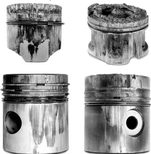
Рис. 1. Примеры выходов из строя поршней из-за возникновения износов, задиров и проплавов

В целом характерные варианты потери физической надежности поршней можно разделить на две основные группы. К первой относятся износы, задиры и проплавы, ко второй – возникновение трещин в зоне кромок камер сгорания. Примеры указанных вариантов потери прочности поршней представлены на рис. 1,2.