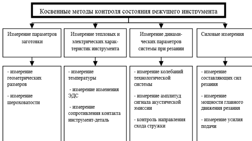
Рисунок 2 – Косвенные методы контроля состояния режущего инструмента

Наиболее «эластичным» направлением в контроле режущих инструментов является мониторинг (непрерывный контроль) непосредственно в процессе обработки. Все методы диагностики текущей работоспособности режущих инструментов можно условно разделить на четыре группы [13], а их, в свою очередь, на методы прямого контроля, основанные на непосредственной регистрации величины износа инструмента, и косвенного контроля (рисунок 2), использующие физические явления, которые сопровождают процессы резания и изнашивания инструмента [12].