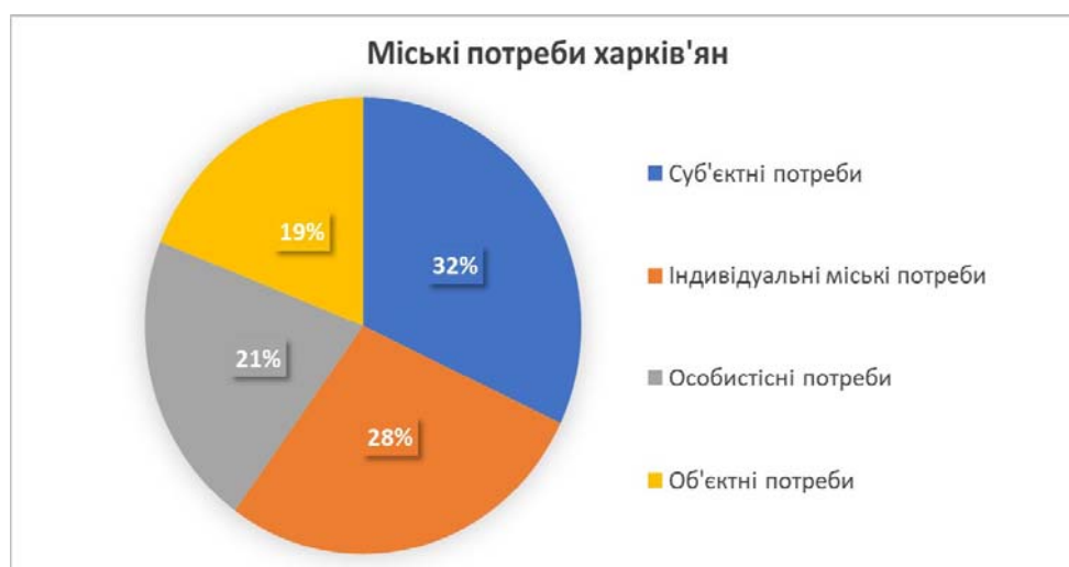
Рис. 3. Міські проблеми харків'ян

За результатами опитування 32 % респондентів поставили на 1-ше місце суб'єктні потреби; 28 % – вказали на індивідуальні міські потреби; 21 % – турбують особистісні потреби; 19 % – об'єктні потреби.