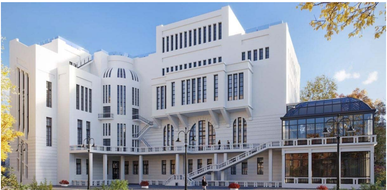
1911-1913 Будівля клубу громадських зборів у Єкатеринославі (Дніпрі).