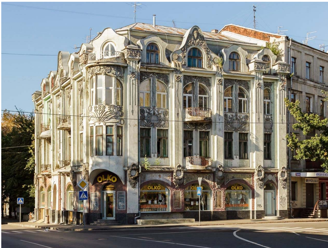
1907. Прибутковий будинок Селіванових у Харкові

Влада визнала його діяльність шкідливим проявом сіонізму. Чотири роки він бідував, залишений без засобів існування, у 1949 році захворів і помер. Був похований в Харкові. На багато років його ім'я було піддане забуттю. У наш час 20 будівель, зведених за проектами Олександра Гінзбурга у Харкові внесені до переліку пам'яток архітектури та вважаються перлинами міста.