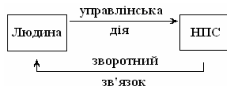
Рис. 1. Взаємозв'язок відносин «людина–навколишнє природне середовище»

Корисність полягає в інформативності та представленні багатофакторних даних в універсальній компактній кількісній оцінці на відміну від інших методів оцінки впливу на об'єкти НПС. Зручна форма має визначатися ступенем компетенції ОПР. У вигляді корпоративної інформаційної системи інформаційний екологічний портрет буде характеризувати зворотний зв'язок відносин „людина–природа” (рис. 1).