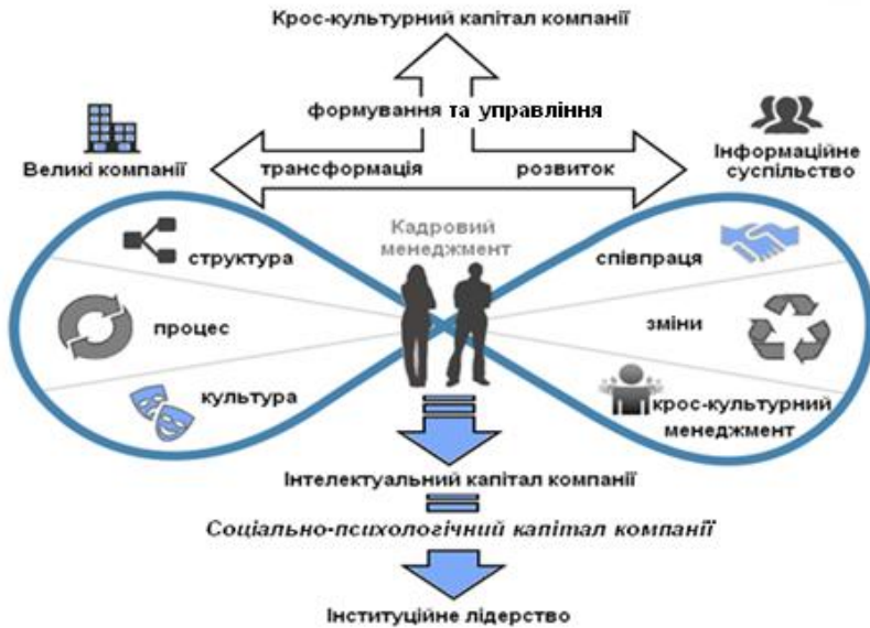
Рис. 3. Динаміка крос-культурного капіталу компанії.

Як ми визначили вище, крос-культурний капітал компанії є стратегічним ресурсом компанії, який формується у процесі діяльності компанії на базі інтелектуального та соціально-психологічного капіталів компанії та має позитивні економічні й психологічні ефекти як на макрорівні (компанія) так й на мікрорівні (розвиток інтелігентності та особистості працівника). Тому, розвиток крос-культурного капіталу компанії позитивно впливає на економічну поведінку людини, яка стає економічно успішною особистістю та задовольняє свої потреби завдяки покращенню умов та рівня життя. Таким чином на рівні суспільства активність, розвиток та безпосереднє підвищення рівня професійних й комунікативних крос-культурних компетенцій формує унікальний крос-культурний капітал компанії та сприяє добробуту суспільства в цілому. Для оптимізації крос-культурного менеджменту у Лівані менеджери повинні дотримуватися суворих правил протоколу поведінки, який диктують ліванські традиції та ритуали. Враховуючи мозаїчність та переплетіння різних культур та традицій, зазвичай мультинаціональні компанії, які працюють на території Лівану, запрошують на роботу саме ліванських спеціалістів, яким легше вдається налагоджувати необхідні контакти з колегами та регіональними партнерами по