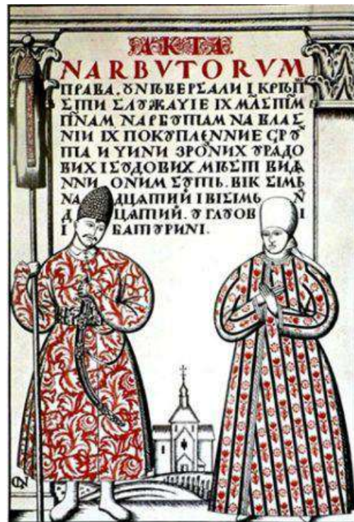
Титульний аркуш збірки родинних документів Нарбута. 1917

На аркушах «Абетки» по дві літери. Кожна ліва – справжній твір образотворчого мистецтва. Права ж літера – зразок графічного дизайну. І цей синтез – ознака епохи, що поєднала і в той же час показала своєрідність двох видів естетичної творчості в сучасній культурі. Г. Нарбут одним із перших це усвідомив.