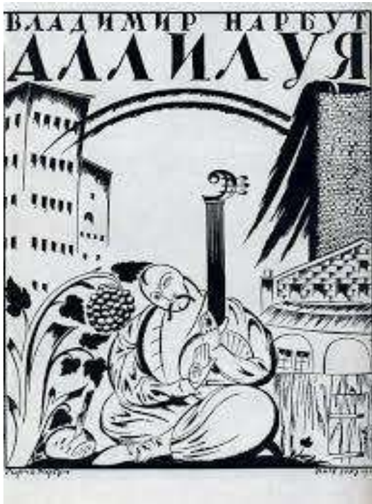
Титульна сторінка книжки В. Нарбута «Аллилуя». 1919

На замовлення Центральної Ради Нарбут виконав і зображення герба УНР, де на блакитному восьмикутнику – постать козака в обрамленні орнаменту з тризубом угорі. У проєкті державної печатки із зображенням козака з рушницею майстер, ймовірно, використовував зразки гетьманських печаток П. Дорошенка, І. Мазепи, К. Розумовського, П. Калнишевського. Тоді ж Г. Нарбут працює і над проєктом великого герба. На жаль, до нас дійшла лише його обкладинка. В ній, з одного боку, зображені фігури гетьмана, вченого та козака Мамаю, що, за задумом художника, символізували державне управління, якісну освіту та український менталітет, з іншого – робітник зі щитом, на якому зображений тризуб. До речі, обличчя всіх фігур схожі. Так поєднав автор історію і сучасність.