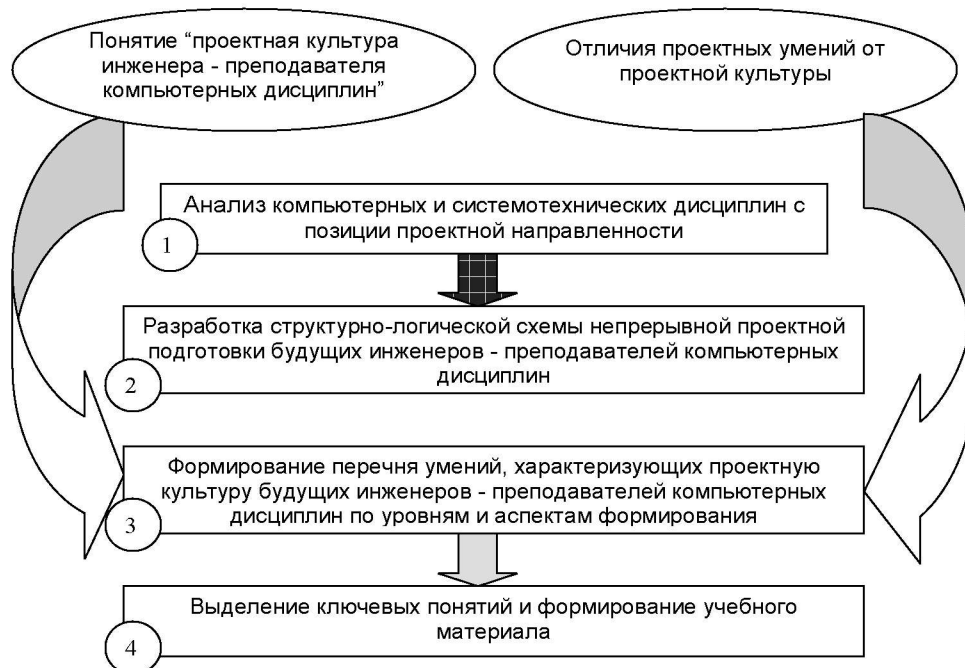
Рис. 1. Логическая структура метода определения структуры и содержания учебного материала

Изложение основного материала. Логическая структура метода определения структуры и содержания учебного материала, формирующего проектную культуру в процессе системотехнической подготовки, представлена на рис. 1. Как видно, метод реализуется в четыре последовательных этапа. Опишем эти этапы.