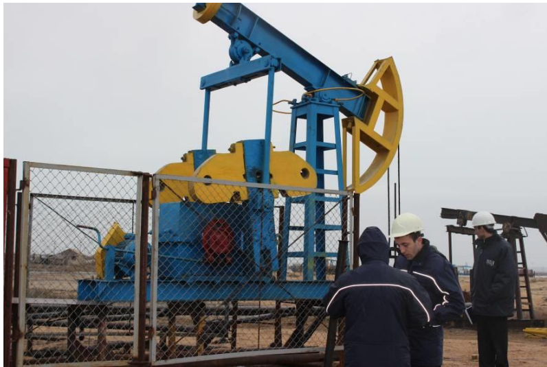
Рисунок 4 – Мониторинг работы станка-качалки СКД 3-1,5-710 с трехступенчатым двухпоточным пакетным редуктором с U_{\Sigma}=64 на промысле Пираллахы

Во время работы станка-качалки на нефтепромысле Пираллахы проводился ежедневный визуальный контроль и еженедельный мониторинг работы трехступенчатого пакетного редуктора на станке-качалке СКД 3-1,5-710, а также контроль выработки скважины по графику нефтепромысла.