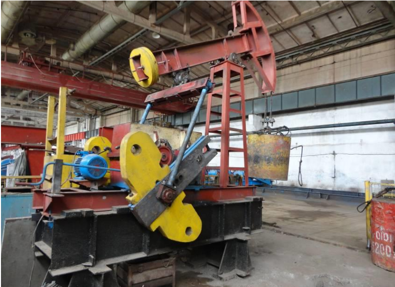
Рисунок 2 – Стенд-качалка для испытания трехступенчатого двухпоточного пакетного редуктора с U_{\Sigma}=64

Результаты испытаний приведены в таблице 2.