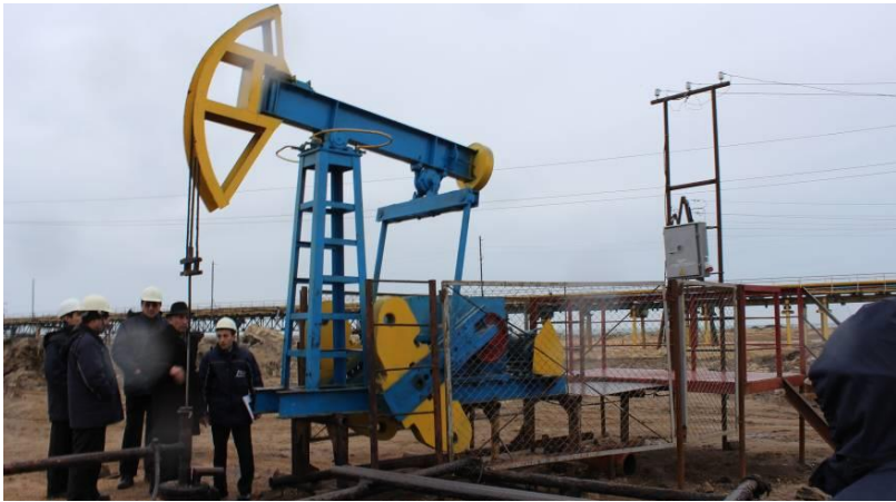
Рисунок 3 – Установка и пуск станка качалки СКД 3-1,5-710 с трехступенчатым двухпоточным пакетным редуктором с U_{\Sigma}=64 , на промысле Пираллахы