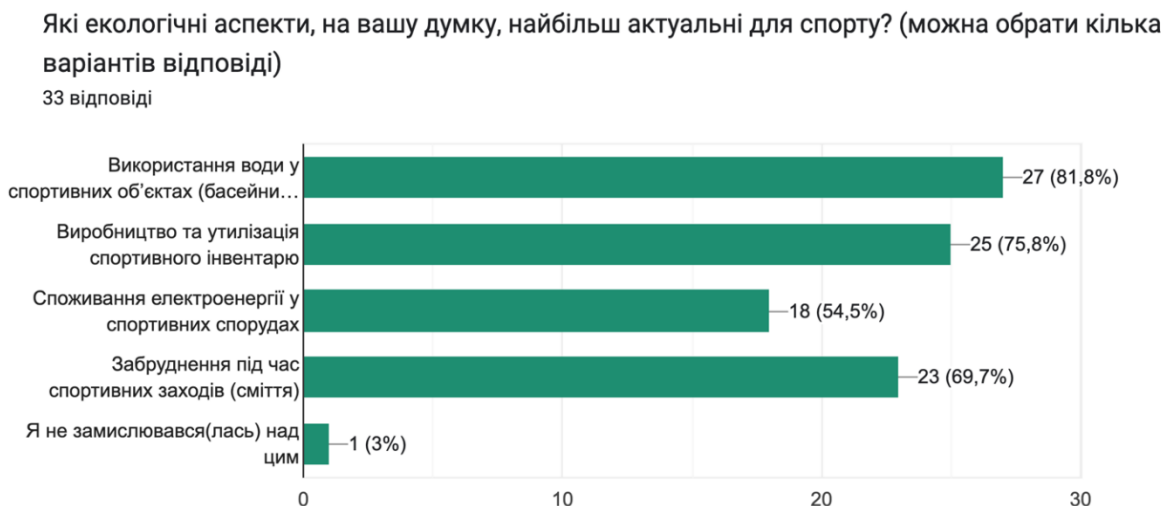
Рис. 2. Результати опитування щодо актуальних екологічних проблем у спорті

Цікавим виявилось й те, що на запитання «Найбільш актуальні екологічні аспекти у спорті» студенти найчастіше обирали такі відповіді (рис. 2):