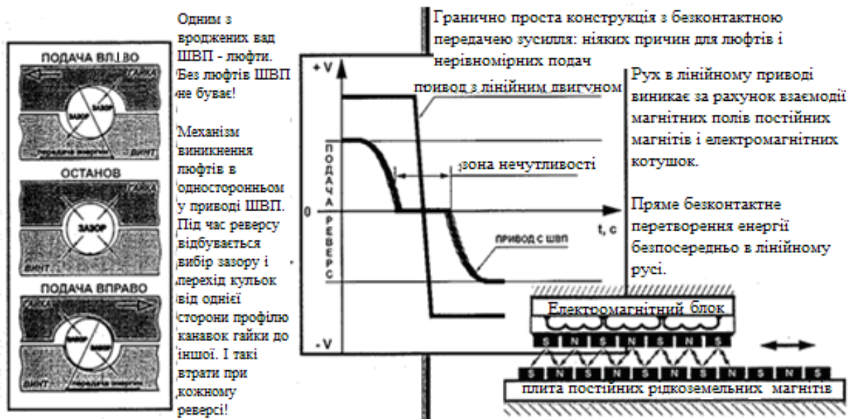
Рис. 3. – Порівняльна характеристика приводів з КПП та лінійного

Лінійний привід коригує зазор 500 разів в секунду з дискретністю 0,1 мкм. У КПП - 4 мкм + 3 мм редуктор + ремінь, Разом \approx 0,01 мм.