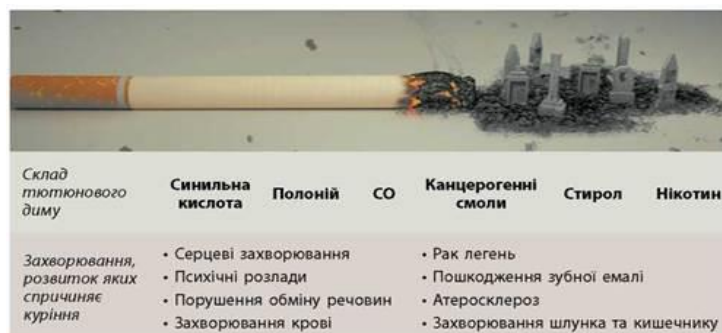
Рис. 1. - Продукти куріння та його негативні наслідки

Тютюнопаління стає шкідливою звичкою через звикання людини до нікотину, який міститься в тютюні. Нікотин насамперед діє на клітини нервової системи, але й органи дихання й травлення також страждають. Продукти куріння потрапляють в організм через органи дихальної системи, тому вони потерпають найбільше. Самі продукти куріння є дуже різноманітними, але в усіх випадках їх потрапляння в організм стає причиною порушень роботи багатьох систем органів (рис. 1) [9, с. 66].