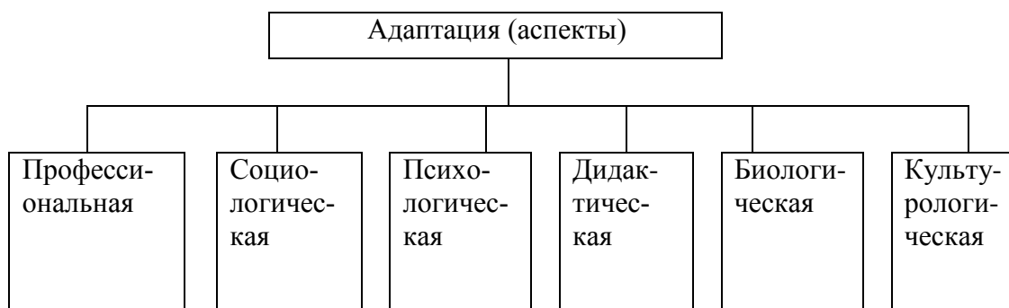
Схема 1. Классификация аспектов адаптации арабских студентов на ПО.

Таким образом, дополним 5 аспектов адаптации первокурсника, выделенные Л.З. Гостевой и Д.А. Еленской [3] (профессиональный, социальный, психологический, дидактический и биологический), шестым, культурологическим, аспектом, связанным с новыми условиями, принципами, ценностями другого общества, чтобы четко представить аспекты адаптации арабских студентов в Украине в виде структурной схемы (см. Схема 1).