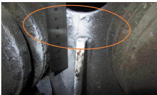
Рис. 1 – Тріщина кронштейна кріплення на візку проміжних балок коліскового підвішування кузова

– тріщини в основному металі кронштейна кріплення на візку проміжних балок коліскового підвішування кузова (рис. 1);