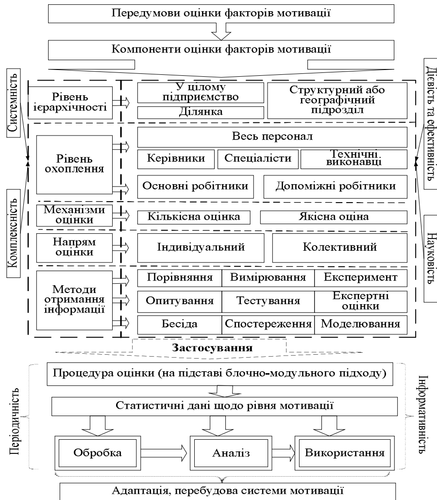
Рис. 1. Методичний підхід до формування системи показників оцінки факторів мотивації (джерело: авторська розробка)

Доцільним також є включення до пропонованого методичного підходу з оцінки факторів мотивації такого елемента оцінки як «рівень охоплення». Цей елемент оцінки дозволяє уточнити оцінку факторів залежно від виділеної групи або якісної характеристики персоналу (стать, вік, рівень утворення, кваліфікаційний рівень, стаж роботи тощо). Виділення елемента «рівень охоплення» дозволяє проаналізувати універсальність і ефективність (у розрізі груп і якісних характеристик персоналу) використовуваних підприємством мотиваційних факторів, а також спрямувати корегувальний вплив на відповідну групу персоналу машинобудівного підприємства в розрізі статевовікових та інших обраних якісних характеристик.