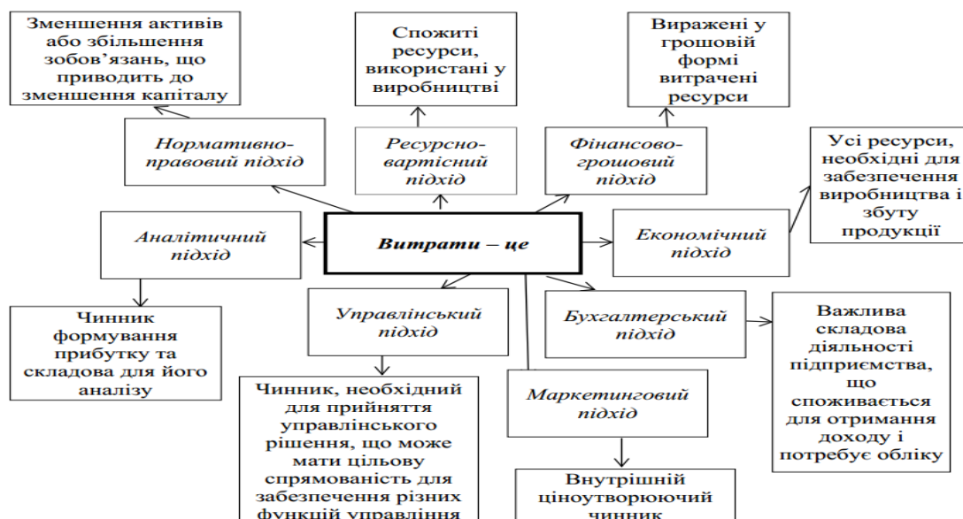
Рисунок 1 – Система підходів до трактування категорії витрати

Проблема формування єдиного, дієвого та універсального методичного підходу до управління витратами промислового підприємства є важливим аспектом для його успішності на конкурентних внутрішніх ринках України та при веденні зовнішньоекономічної діяльності на світовому ринку. Основою формування методичного підходу до управління витратами промислового підприємства є чітке розуміння економічної сутності категорії «витрати». Систематизуємо складові компоненти поняття «витрати» за усіма підходами та проілюструємо на рисунку 1.