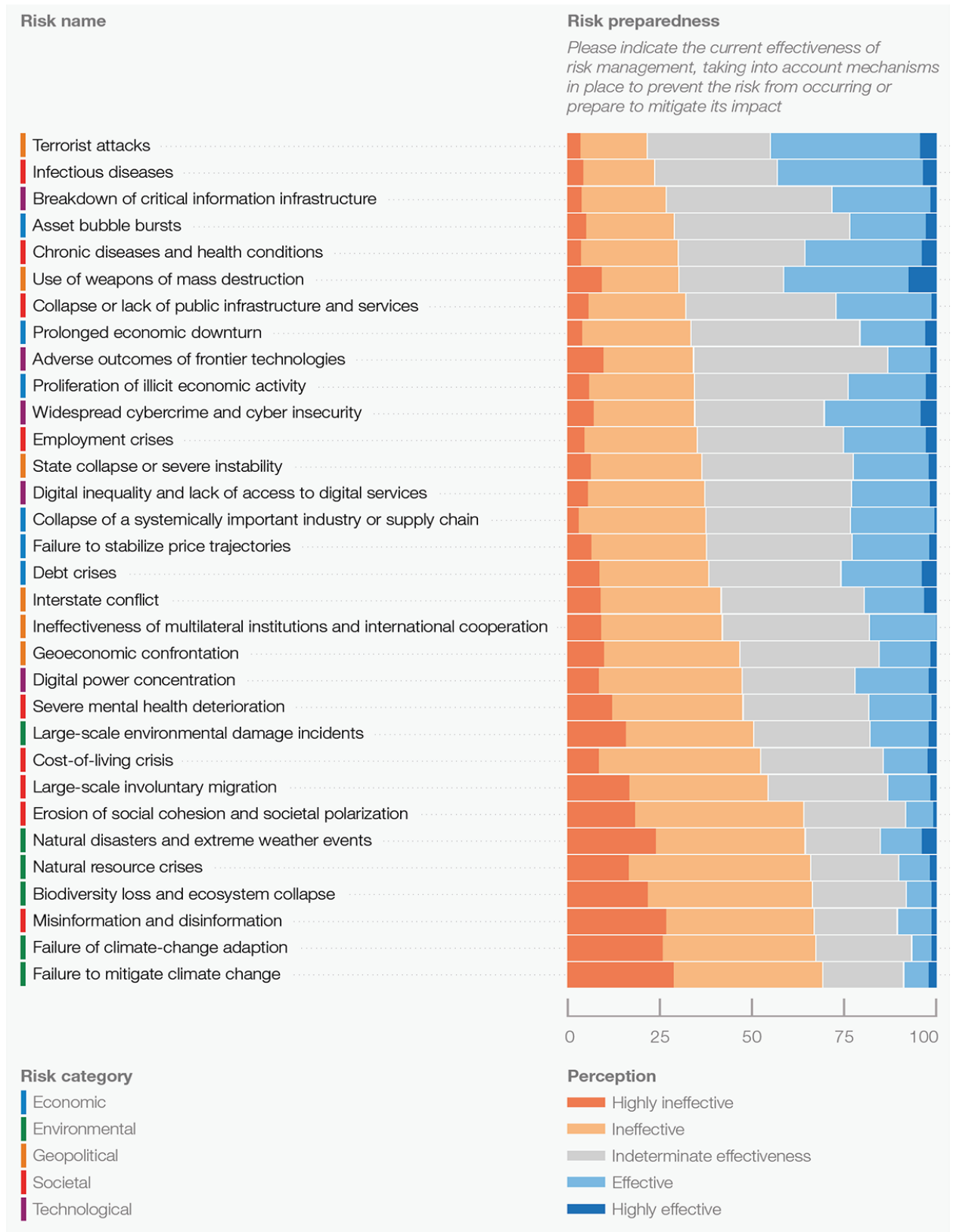
Рис. 2. Готовність до глобальних ризиків у 2023 році [23]