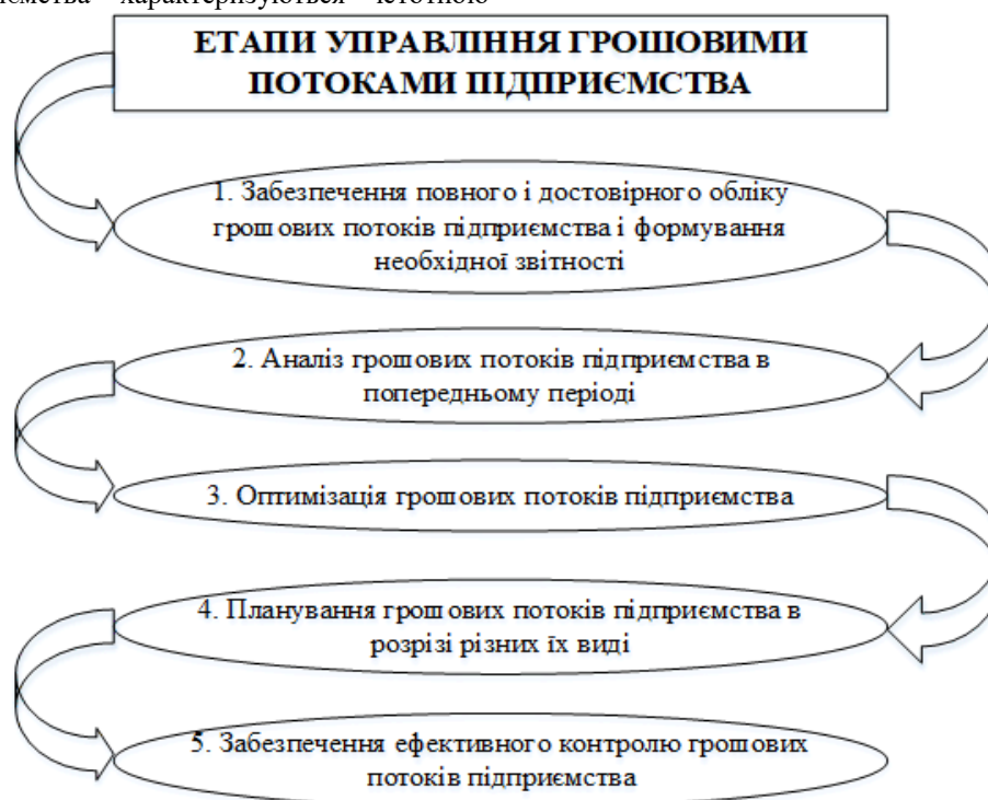
Рис. 1. Основні етапи управління грошовими потоками підприємства

Основною метою управління грошовими потоками є забезпечення фінансової рівноваги підприємства в процесі його розвитку шляхом балансування обсягів надходження і витрачання грошових коштів і їх синхронізації в часі. Процес управління грошовими потоками підприємства послідовно охоплює наступні основні етапи [5-7] (рис. 1).