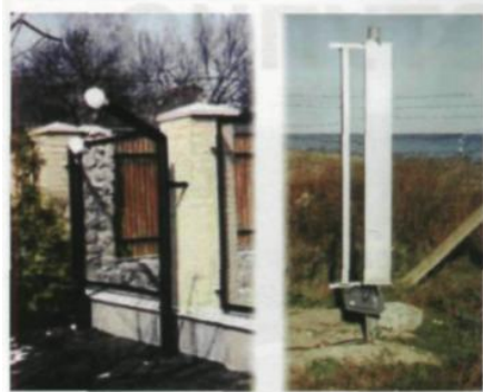
Рис. 2. Варианты использования периметровых СВЧ-датчиков охраны

Локационный метод. К нему относятся устройства, действие которых основано на использовании эффекта Доплера, заключающегося в изменении частоты сигнала, отраженного от движущегося объекта. СВЧ-передатчик приемопередающего модуля извещателя излучает в охраняемую зону электромагнитные колебания, которые, отражаясь от окружающих предметов, попадают на СВЧ-приемник приемопередающего модуля, образуя зону обнаружения. При появлении в зоне обнаружения нарушителя происходят изменения принимаемого сигнала, после обработки которых извещатель выдает тревожное извещение. Примером могут служить: «ФАНТОМ-10У» ЗАО «ОХРАННАЯ ТЕХНИКА», Россия; «СП4У40» ЗАО «ОХРАННАЯ ТЕХНИКА» Россия и т. д.