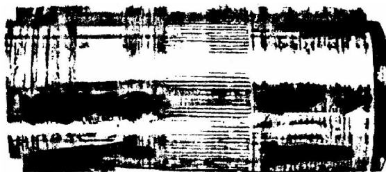
Рис. 2. Поршневой палец с бринулированием

форсировании двигателей уровень максимального давления сгорания в цилиндрах достиг 15 МПа. При этом значительно возросла температура поршня, деталей подшипника ВГШ. В ходе испытаний форсированных двигателей со штатной конструкцией имели место: бринулирование поршневых пальцев (рис. 2) и втулок; выкрашивание роликов, беговых дорожек втулок и поршневых пальцев. Дефект начинал развиваться с образования повышенного износа и выкрашивания периферийных поверхностей роликов. Расчетно-экспериментальными исследованиями было установлено, что причиной данного дефекта является защемление концов роликов при деформации поршневого пальца от сил давления газа в цилиндре при наличии высокой температуры данных деталей.