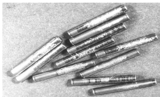
Рис. 4. Игольчатые ролики с началом разрушения

Дальнейшее повышение работоспособности подшипника ВГШ возможно за счет применения сталей с более высокими механическими свойствами при рабочих температурах. Так, применение подшипника из более теплостойкой стали типа ЭИ347Ш (8Х4В9Ф2-Ш) позволило значительно повысить его работоспособность и долговечность за счет более высокой температуры отпуска стали (для ШХ15-Ш температура отпуска 150°С, а для ЭИ347Ш - 400°С) [3].