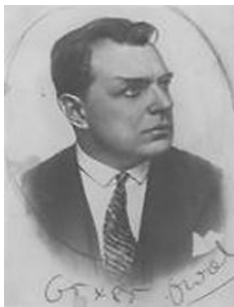
В. В. Бердяев (1885–1956)

первым разработал метод, позволяющий генерировать бесконечное количество ритмических фигур, а также научно анализировать модели прошлого. Это позволило нам проследить происхождение языка и музыки до небывалых степеней» [14].