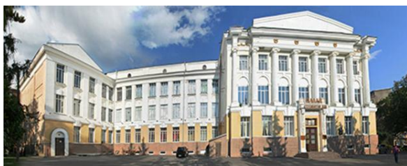
Дворец студентов НТУ «ХПИ»

Изучив архивные материалы по истории университета в преддверие его 130-летнего юбилея можем с уверенностью утверждать, что библиотека, как и весь коллектив НТУ «ХПИ» по-прежнему верна традициям созидания и просвещения.