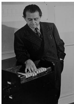
И. М. Шиллингер (1895–1943)

У истоков становления клуба, его успешной деятельности стояли известные деятели искусства, состоявшие в штате преподавателей ХТИ.