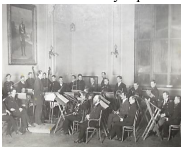
Концерт симфонического оркестра ХТИ