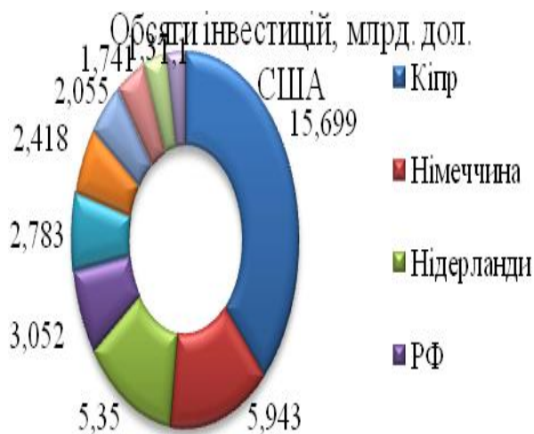
Рис. 2 – Країни-інвестори та обсяги інвестицій в економіку України за 1 півріччя 2014 року

Інвестиції прийшли із 133 країн світу. Основними інвесторами України, на яких припадає 55% від загального обсягу інвестицій, залишалися Кіпр, Німеччина та Нідерланди. Більш детально з країнами-інвесторами можна ознайомитись на рисунку 2.