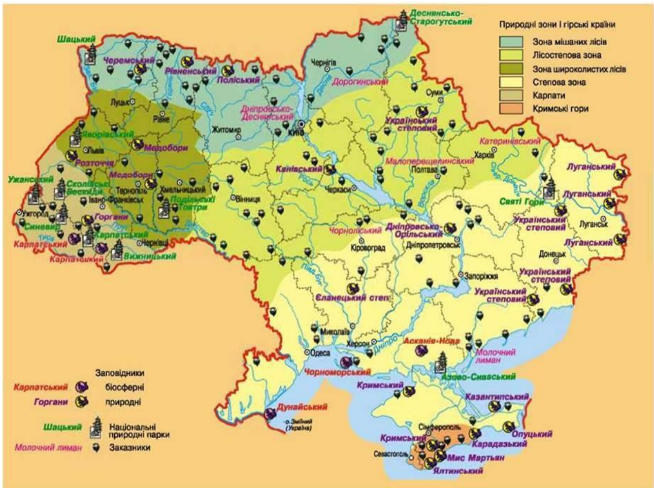
Картосхема Природно-заповідного фонду України

Використовуючи карту Природно-заповідного фонду України, проаналізуйте регіони за кількістю та різноманітністю об'єктів (Карпати, Полісся, Південь України). Визначте рейтингові території для екотуризму та складіть план маршруту для туристичної поїздки з огляду на природні та культурні ресурси.