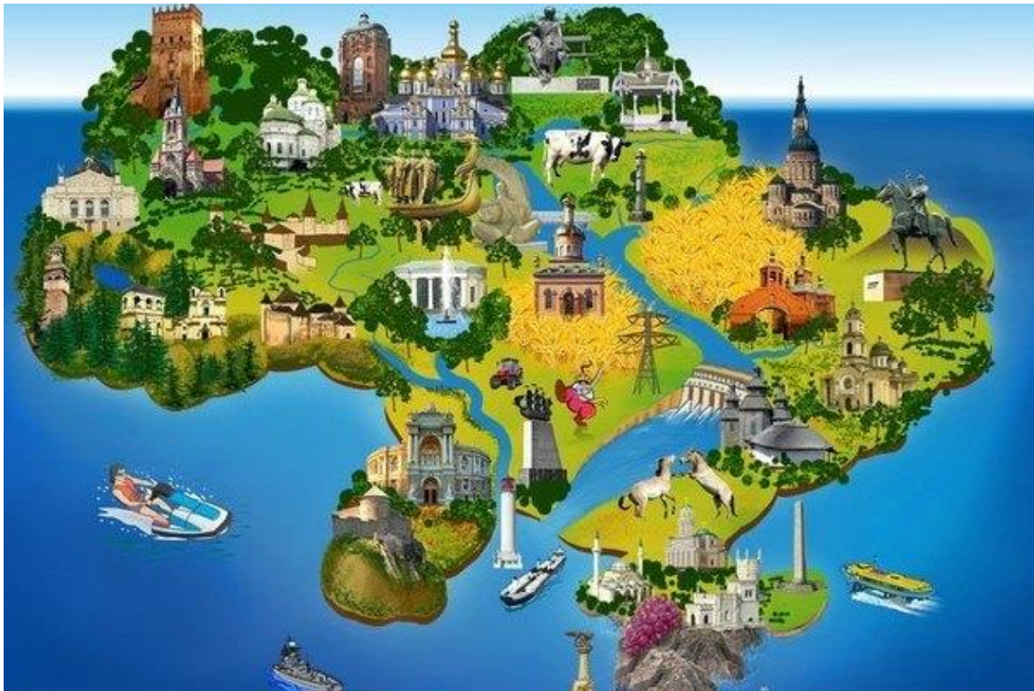
Карта туристичних об'єктів України

Проаналізуйте туристичний потенціал одного регіону України (наприклад, Львівська або Чернівецька область) із урахуванням археологічних, архітектурних, етнографічних та подієвих ресурсів. Складіть карту маршруту на 2–3 дні, включивши поєднання природних і культурних об'єктів.