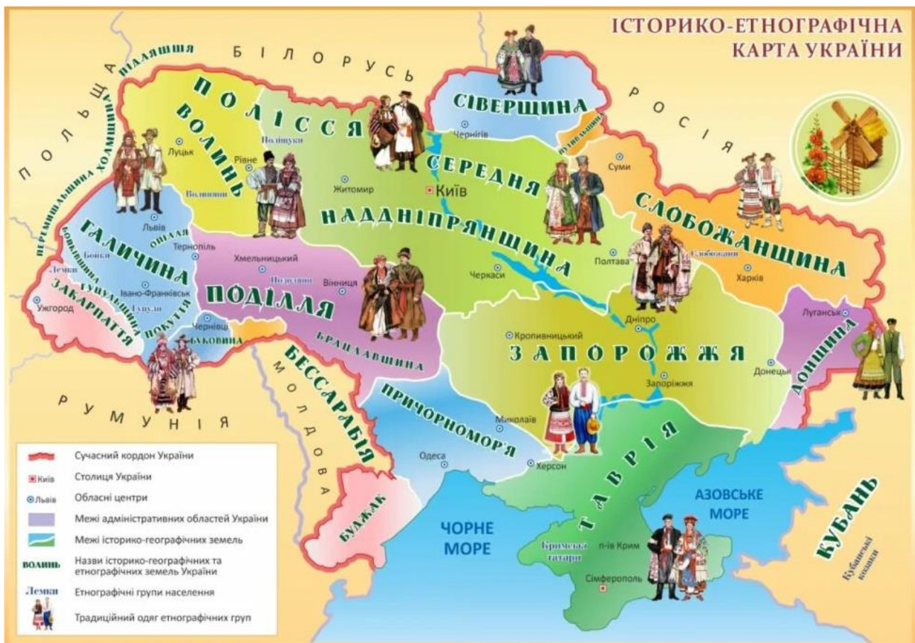
Історико-етнографічна карта України

Оберіть один етнографічний та один подієвий ресурс (Карпатські гуцули, фестиваль «Кам'янець-Подільський фортеця-фест») та проаналізуйте їх інтеграцію у туристичні маршрути регіону. Визначте, як вони підвищують туристичну привабливість та локальний економічний ефект.