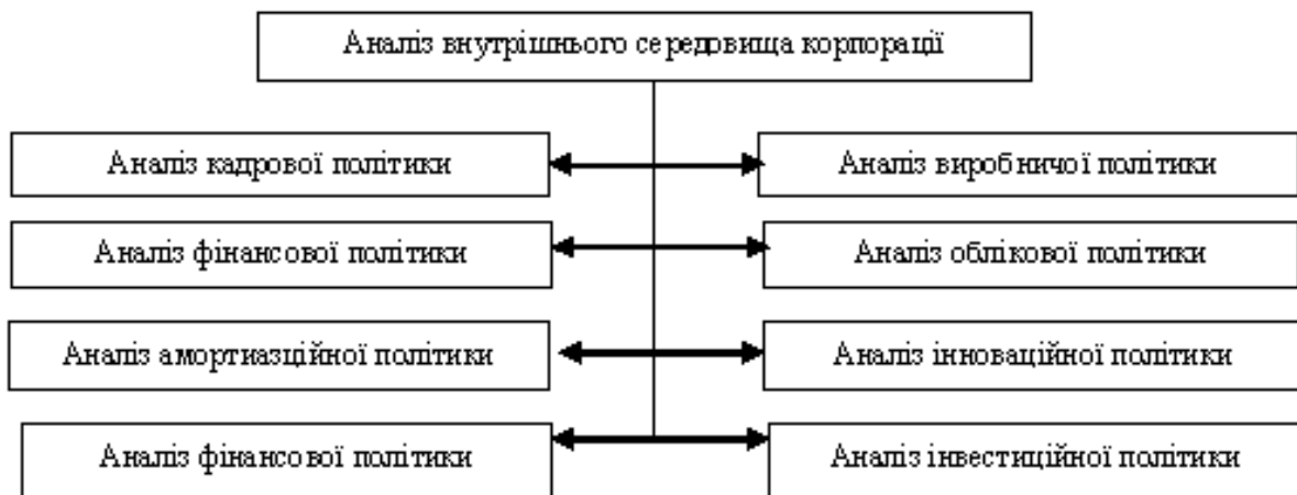
Рис. 2 – Складові аналізу внутрішнього середовища

Відповідність визначених політик можна визначити шляхом співставлення запланованих цільових параметрів з фактичними та відповідність досягнутих критеріїв темпам розвитку ринку та забезпеченням цих темпів необхідними параметрами відтворювальних процесів.