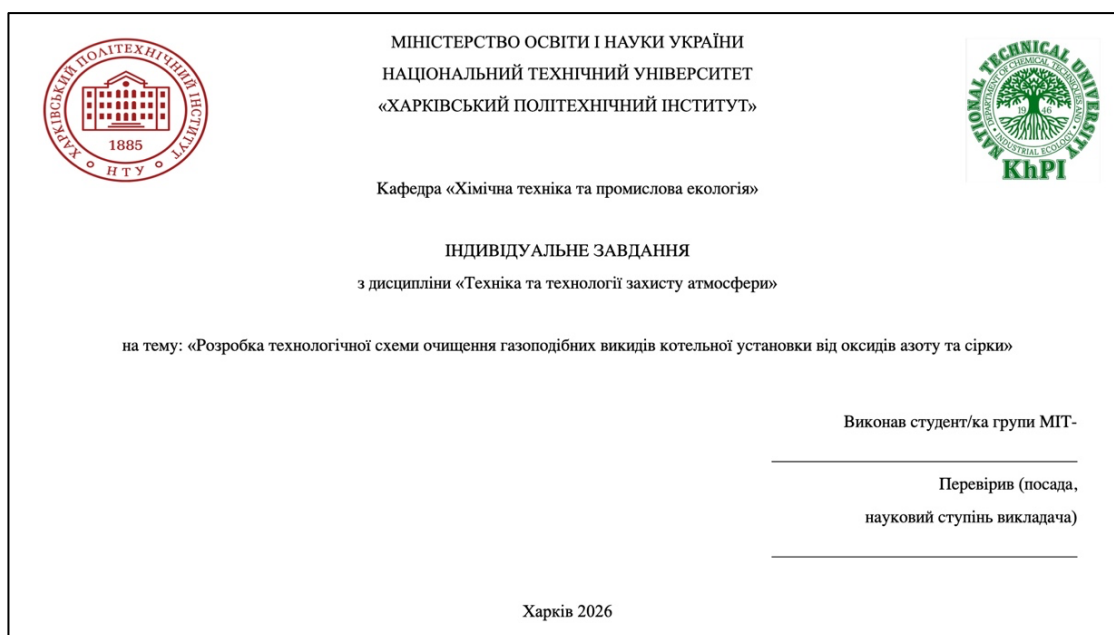
Рисунок 6.3 – Приклад оформлення першого аркушу презентації

Кожен слайд повинен містити заголовок, який підсумовує інформацію, яка висвітлена на слайді. Презентація має бути логічною, тобто мати початок та кінець. Слайди призначені для того, щоб доповнити доповідь, а не бути основним читабельним текстом.