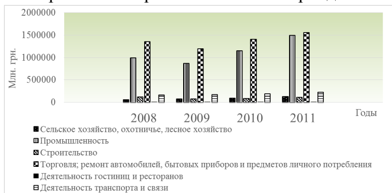
Рис. 2 – Динамика объемов реализованной продукции субъектов реального сектора экономики Украины по видам экономической деятельности за период 2008-2011 гг., млн. грн.

Как видим, рис. 2 иллюстрирует рост объемов реализованной продукции субъектов реального сектора экономики Украины по всем видам экономической деятельности за анализируемый период. Однако, несмотря на сложившуюся тенденцию субъекты хозяйствования строительства, гостиниц и ресторанов так и не смогли получить прибыль на протяжении всего периода.