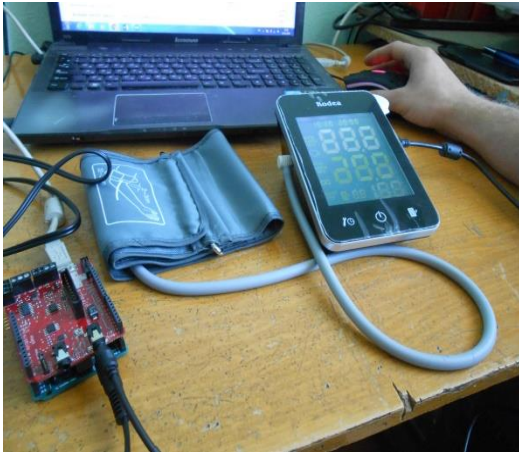
Рис.1. Экспериментальный стенд телемедицинского тонометра

Результаты экспериментов. В лаборатории биомедицинской электроники НТУ ХПИ нами было произведено исследование возможности дистанционно передачи достоверных данных тоно- и пульсметрии, снятых с помощью электронного тонометра.