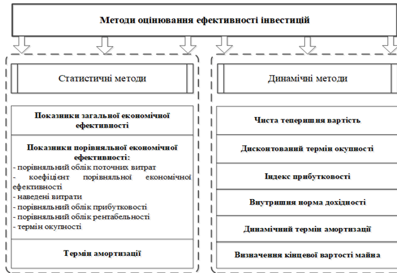
Рисунок 1 – Методи оцінювання ефективності інвестицій промислового підприємства (зроблено автором на основі 3, 4)

Після проведення усіх досліджень, які передують прийняттю інвестиційного рішення, необхідно скласти певний підсумковий документ, який дозволить інвестору та підприємцю не лише прийняти, а й зафіксувати, що і коли належить зробити, щоб виправдалися сподівання на ефективність проекту. Для цього складається бізнес-план, який є головним інструментом для відбиття підприємницької ідеї. Бізнес-план - це стандартний документ, у якому детально обґрунтовуються концепція призначеного для реалізації реального інвестиційного проекту і наводяться основні його технічні, економічні, фінансові та соціальні характеристики. Він описує основні