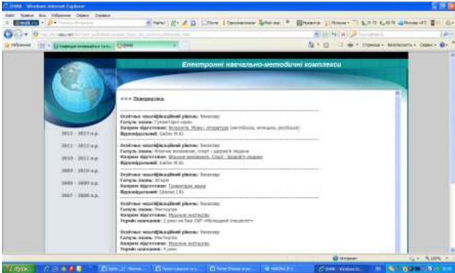
Рис. 4. Головна сторінка ЕНМК «Основи роботи з ПК»

ЕНМК з дисципліни «Основи роботи з ПК» складається з таких розділів: