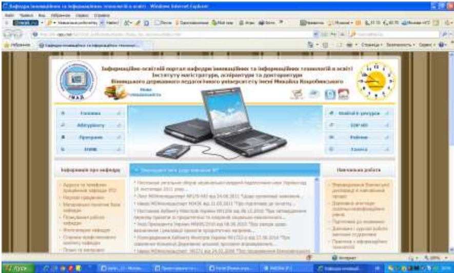
Рис. 1. Головна сторінка порталу кафедри інноваційних та інформаційних технологій в освіті

Аналізуючи зміст ОП, ми бачимо, що кафедра надає можливість користувачам отримувати інформацію про роботу кафедри в різних напрямках: навчальна робота (державна атестація освітньо-кваліфікаційних рівнів; дипломні і курсові роботи, виконані студентами; практика з інформаційних технологій; курсове навчання з робітничих професій; підготовка до екзаменів); наукова робота (напрями та матеріали науково-дослідної роботи; науково-дослідна тема кафедри; підготовка науково-педагогічних працівників; експериментальна робота; Intel проекти «Навчання для майбутнього»; науково-педагогічна практика магістрів; видавнича діяльність кафедри); діяльність кафедри (тематика та матеріали виступів та доповідей на методичних семінарах; всеукраїнські та міжнародні конкурси; співпраця з вітчизняними навчальними закладами; співпраця з зарубіжними навчальними закладами; відкриті заняття викладачів кафедри); інформація про кафедру ( адреси та телефони працівників кафедри; наукові працівники; планування роботи кафедри; фотогалерея кафедри); сторінка профспілкового комітету кафедри; плани та матеріали виховної та позаурочної роботи; педагогічне програмне забезпечення; абітурієнту; програми; електронні на-