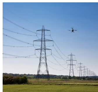
Рис. 5 – Контроль стану ЛЕП за допомогою БПЛА

Для контролю характеристик довкілля просторово розгалужених об'єктів енергетики за останній час розроблені методи побудови КІВС на базі БАК [12]. При цьому основною складовою БАК є безпілотний літальний апарат (БПЛА) (рис. 5).