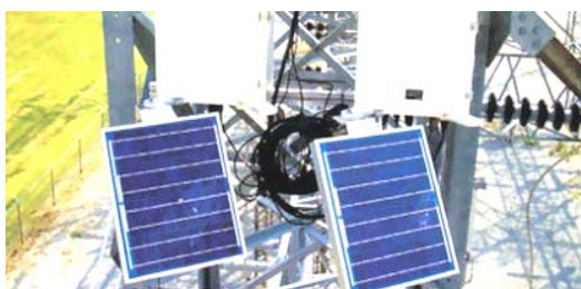
Рис. 2 – Панелі сонячної батареї модуля живлення системи "CAT-1"