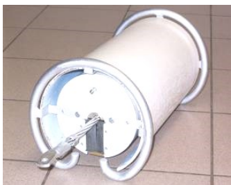
Рис. 4 – Датчик DiLin-Sensor

Датчик DiLin-Sensor виготовлений у вигляді циліндра, що монтується на проводах ЛЕП, має діаметр 200 мм і завдовжки 300 мм. Конструкція датчика DiLin-Sensor наведена на рис. 4.