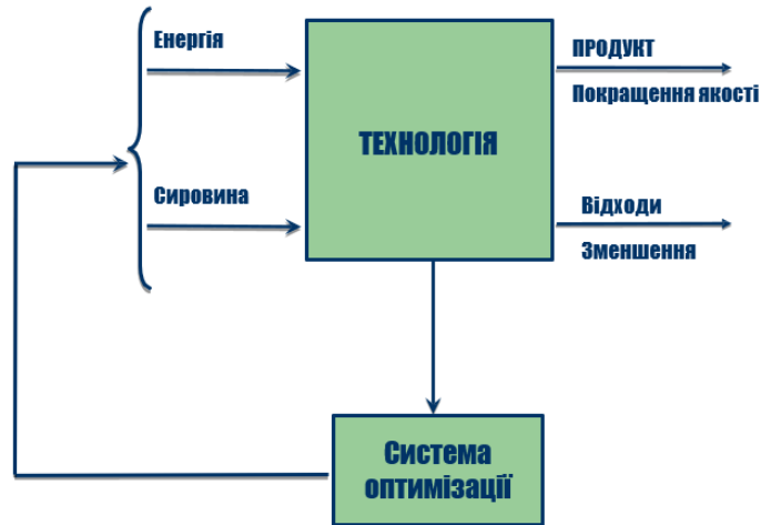
Рис. 3 - Оптимізація діючих виробництв

також змушує технологів використовувати різні методи поліпшення якості сировини. Очевидно, що чим менше домішок в сировині, тим менше потрапляє побічних, в основному шкідливих продуктів в цільовий продукт і тим менше викидів. Реалізація цих оптимізаційних підходів однозначно призводить як до поліпшення якості продукції, так і зниження відходів (рис. 3).