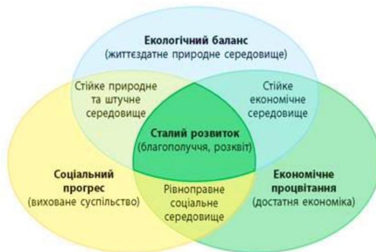
Рис.1 - Складові концепції сталого розвитку

Концепція сталого розвитку з'явилася в результаті об'єднання трьох основних складових (рис.1): економічної, соціальної, екологічної.