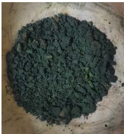
Рис.1. Випалений концентрат хрому

В результаті випалу одержали шлаковий продукт – золу, яка характеризується високим вмістом оксиду хрому ( \text{Cr}_2\text{O}_3 ) (рис. 1, табл. 1). Завдяки правильному режиму спалювання і оптимальним температурним умовам (температура перевищує 600–800 °С, а в деяких випадках може бути ще вищою) органічна частина практично повністю видаляється, і одержана зола насичується оксидом хрому. В результаті оксид хрому у складі золи може сягати 50–62%, що свідчить про ефективне видалення органіки та концентрування цінного компоненту для подальшої переробки.