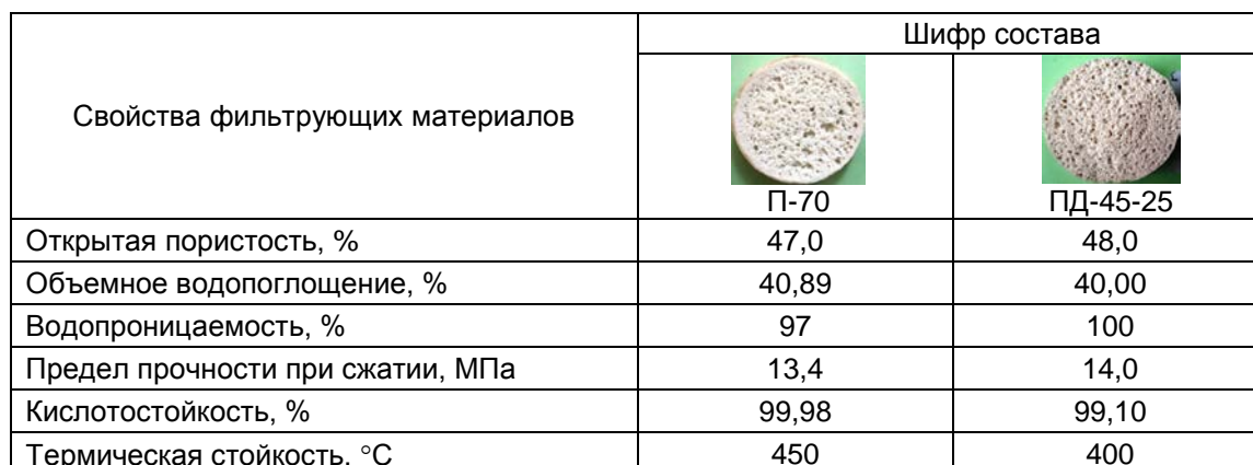
Таблица 2. Свойства и внешний вид фильтрующих стеклокристаллических материалов оптимальных составов

Высокие показатели эксплуатационных свойств пористых материалов этих составов при открытой пористости 47÷48% обеспечиваются тонкодисперсной кристаллизацией основных фаз – цинкового петалита и диопсида с максимальным суммарным количеством кристаллических фаз в материалах 48%, что было установлено рентгенофазовым и петрографическим методами исследований.