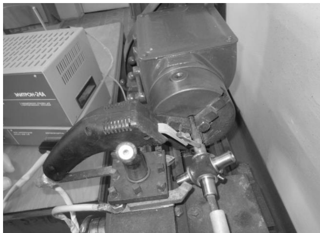
Рисунок 2 – Процес нанесення покриття електроіскровим методом на шип хрестовини карданного валу.

Для отримання рівномірного покриття на шипі, його закріплювали в кулачках, а вібратор – на супорті токарно-гвинторізного верстату. Для забезпечення високої продуктивності нанесення покриття користувалися наступними режимами роботи верстата: частота обертання шпинделя n = 0,75 \text{ с}^{-1} , подача s = 0,455 \text{ мм/об} (див. рис. 2).