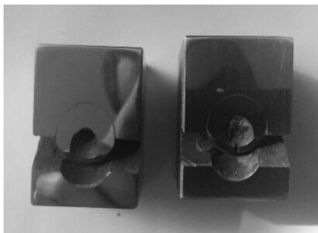
Рисунок 3 – Зразкотримач для виготовлення шліфа.

Оскільки в процесі електроіскрового легування отримується досить тонкий нанесений шар, то для подальшого його вивчення і металографічного аналізу необхідно виготовляти косий шліф. Було запропоновано конструкцію зразкотримача, який дає можливість отримувати такий шліф, у випадку циліндричної бокової поверхні деталі (див. рис. 3).