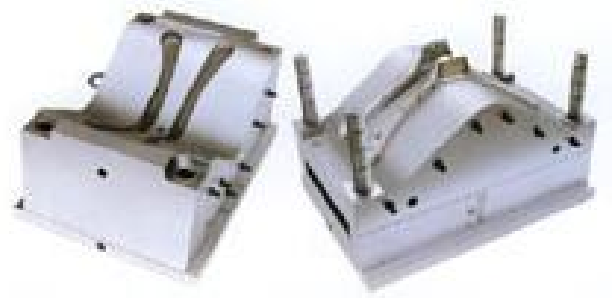
Рис. 2 Стандартная пресс-форма

усилием запираания; 3 – Подача расплава полимера в ЛФ; 4 – Охлаждение изделия (фиксация конфигурации изделия); 5 – Раскрытие ЛФ и извлечение изделия (рис. 1) [4, 5]. Современная технологическая оснастка (рис. 2) повышает производительность и улучшает качество продукции.