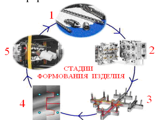
Рис. 1. Стадии формирования изделий методом литья под давлением

Формование изделия методом литья под давлением осуществляется в несколько стадий: 1 – Нагревание полимера в цилиндре; 2 – Смыкание ЛФ с