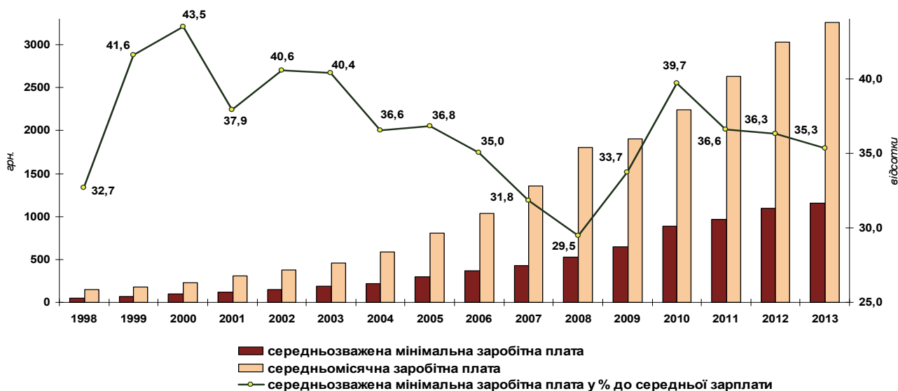
Рис. 3. Динаміка середньомісячної та мінімальної заробітної плати та їх співвідношення

Щорічне підвищення мінімальної заробітної плати не встигає за загальною динамікою зарплати, а відсоткове відношення мінімальної зарплати до середньої (індекс Кейтця) в Україні не дотягує до рекомендованого МОП і Світовим банком у діапазоні 50–60% та має тенденцію до зниження (рис. 3).